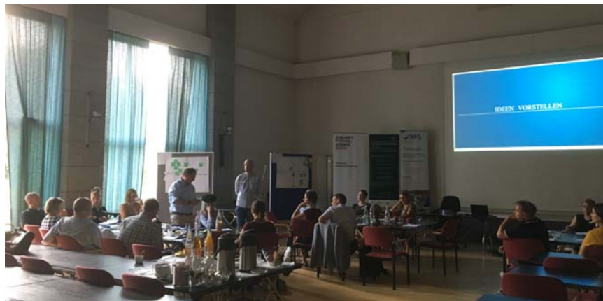
Die Teilnehmer erproben die Design Sprint-Methode

Nach einem abschließendem Resümee seitens der Effizienz-Agentur NRW hatten die verschiedenen Unternehmen noch die Möglichkeit, sich in angenehmer Atmosphäre bei einem kleinen Imbiss auf dem Gelände der Steyler Missionare interdisziplinär auszutauschen, zu vernetzen und bestehende Kontakte zu vertiefen.