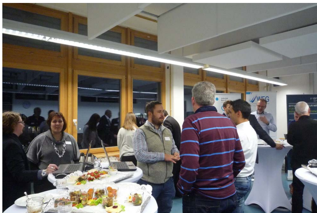
Regel Austausch unter den Teilnehmern, Referenten und Veranstaltern an den Workshop-Tischen.