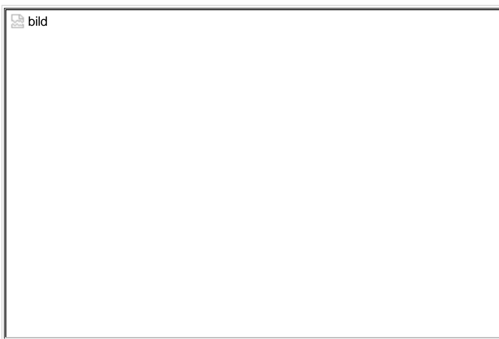
Stand des Jungunternehmer-Stammtisches Sankt Augustin (JUST)

Weitere Informationen zur „11. Sankt Augustiner Wirtschaftsbühne“ finden Sie unter www.wirtschaftsbuehne.de .